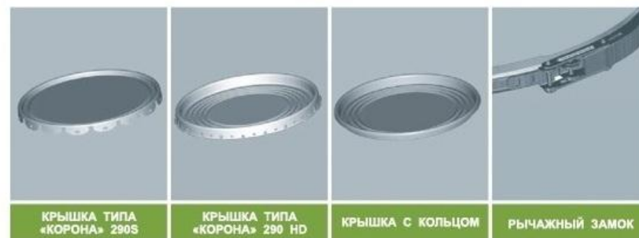
КРЫШКА ТИПА «КОРОНА» 290S